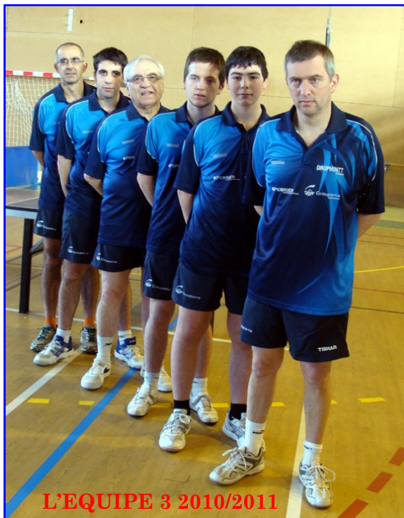
L'EQUIPE 3 2010/2011

La prochaine saison l'équipe connaîtra elle aussi quelques remaniements mais les cadres veilleront à faciliter l'intégration des nouveaux éléments qui ont déjà le niveau de la division.