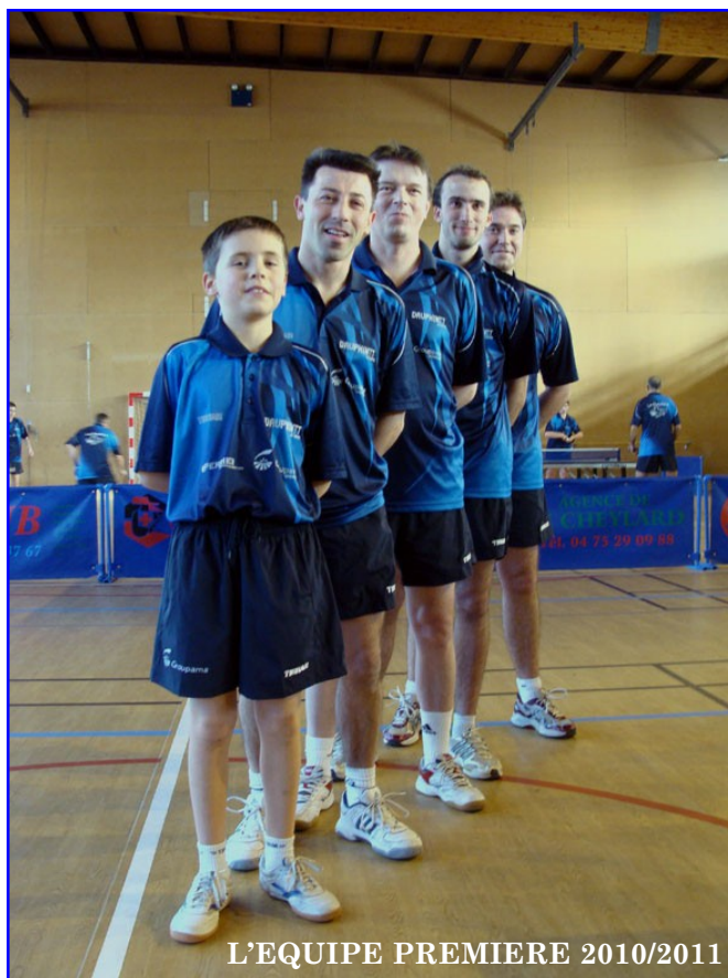
L'EQUIPE PREMIERE 2010/2011