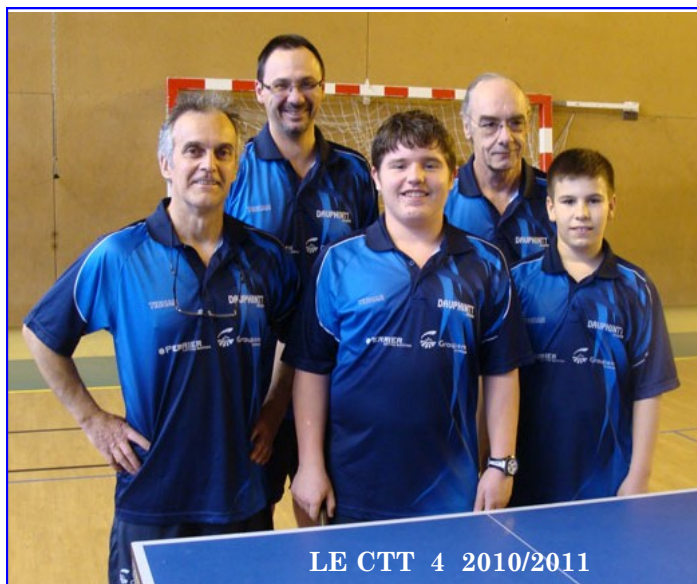
LE CTT 4 2010/2011

Dès septembre de nouveaux joueurs devraient « s'essayer » à la compétition au sein de cette équipe engagée à leur intention.