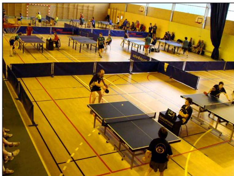
Les finales et barrages départementaux organisés par le club le 13 mai 2010 Le Cheylard était pour une journée la capitale du Ping Drome-Ardèche.