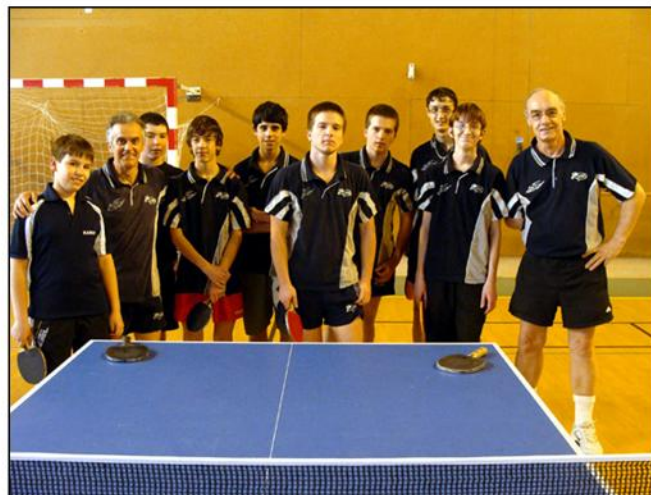
Les deux D3 réunies en mars pour une rencontre amicale avec St MARTIN DE VALAMAS.