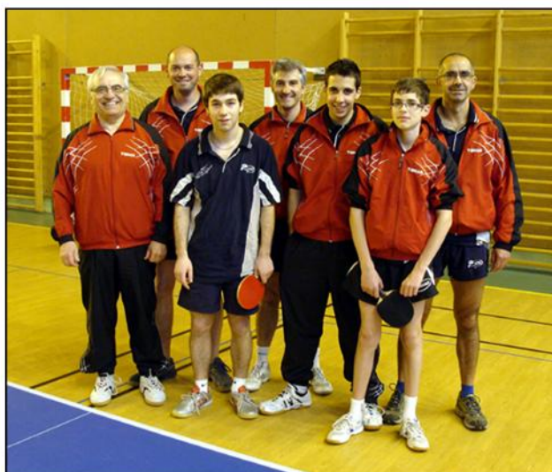
La deux très régulière cette saison devra confirmer ses progrès.