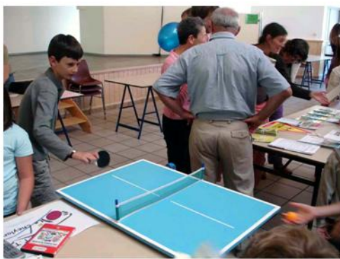
Échanges sur la mini table

Depuis la création du C.T.T notre club a toujours tenu un stand lors de cette importante manifestation annuelle. A cette occasion chacun peut lier connaissance avec les diverses associations du canton et faire son choix pour la saison. Une petite animation était proposée sur une mini table pendant qu'un téléviseur diffusait des images de pongistes en action. Tous les renseignements souhaités pouvaient ainsi être obtenus et l'imprimé remis aux visiteurs récapitulait les informations essentielles.