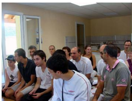
Une partie des personnes présentes