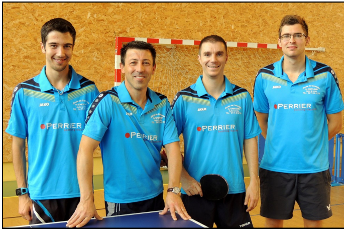
Une première phase plus compliquée que prévu.

Une belle victoire d'entrée à Saint Genis Laval laissait entrevoir une phase d'enfer. Hélas, le match suivant contre Décines fut raté empêchant nos joueurs de se mêler à la lutte pour la première place et d'envisager finir sur le podium. La poule était difficile et les surprises furent nombreuses rendant tout pronostic hypothétique. Au final l'équipe termine à une cinquième place logique (devancée par Décines au goal average), les joueurs ayant eu du mal à jouer à leur classement et encore plus à élever leur niveau de jeu (voir le tableau). L'essentiel est tout de même assuré en maintenant le CTT en R3. Notre équipe fanion disputera en Janvier sa 23ème phase en championnat régional, ce qui n'est déjà pas si mal. Il convient également de féliciter et de remercier Corentin et Arnaud qui bien qu'éloignés du Cheylard restent les piliers indispensables de cette formation, avec Denis et Thomas, les autres titulaires, ils ont disputé tous les matchs en 2017.