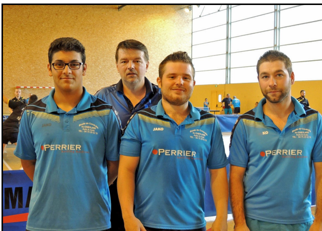
De retour en D1 nos réservistes n'ont pas pu faire douter les leaders